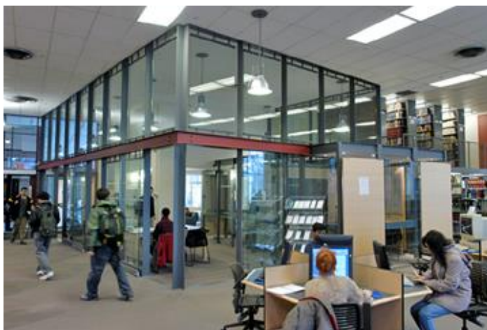
*4 24/7 study space(24 時間スタディールーム)