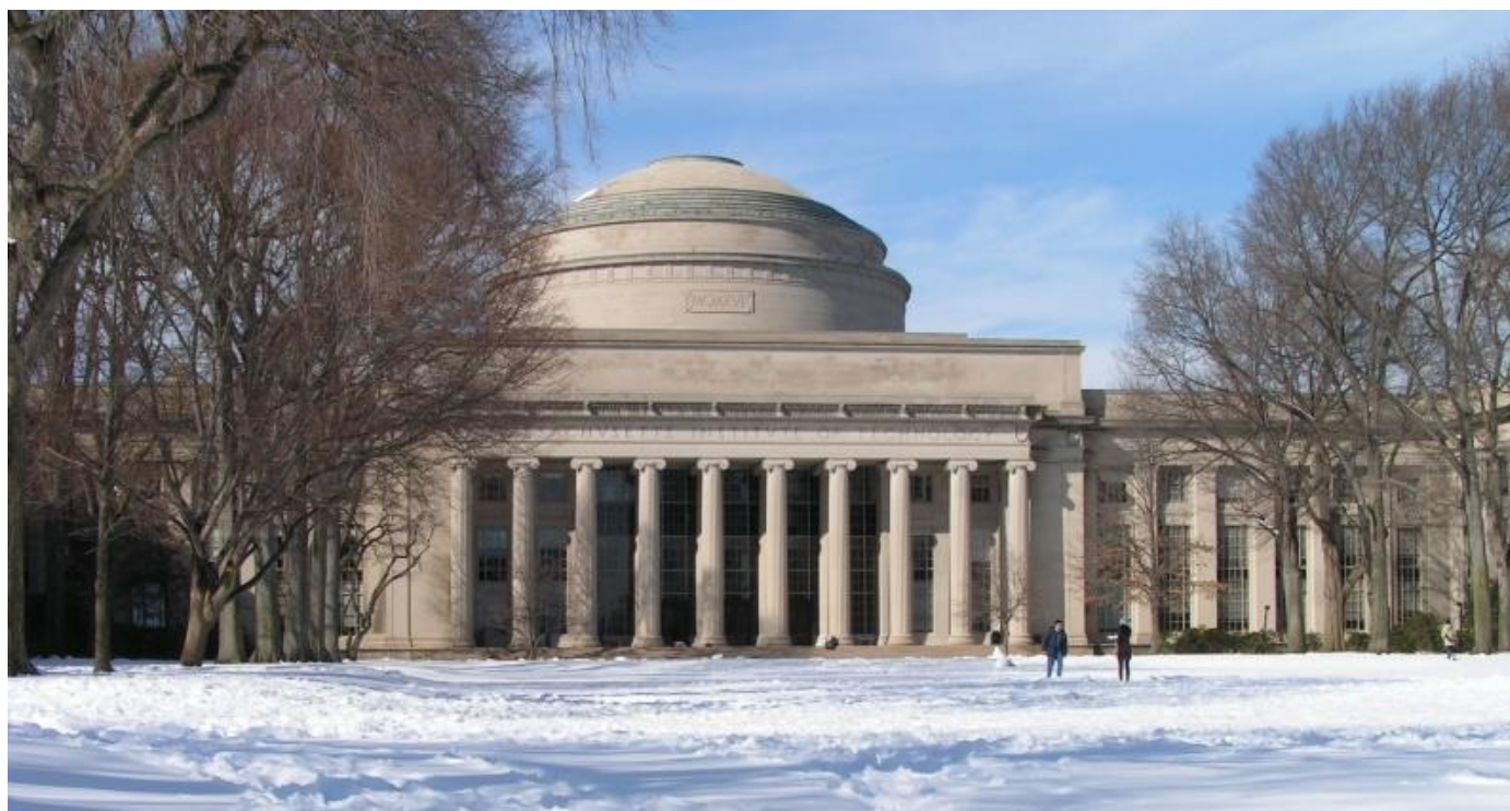
*1 マサチューセッツ工科大学図書館外観

1865年創立のマサチューセッツ工科大学* 1 は、キャンパスのほぼ中央に位置する Hayden Memorial Library* 2 &* 3 を中央図書館として、Baker Engineering、Science(科学)、Dewey(社会科学)、Rotch、Humanities(人文科学)という五つの図書館、より狭い分野に限定された Aeronautics & astronautics : 航空・宇宙工学、Music : 音楽、Earth & Planetary Sciences 地球・惑星科学、Health sciences : 身体学、Visual materials : 視聴覚資料の五つの支部図書館(分館)、二つの保存図書館(文書類・特殊コレクション、RSCと呼ばれる1963年以前の稀覯資料)から構成されている。保存図書館に加え Science、Humanities、Music、Health Sciencesの四つの図書館も中央図書館内にある。また、中央図書館の特徴的な施設として「24/7 study space (24時間スタディールーム)」* 4 が挙げられる。